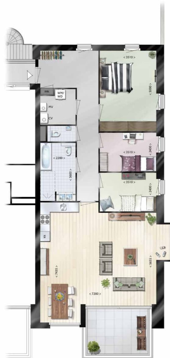
Plattegrond hoekappartement 120m 2

Je nieuwe thuis wordt gebouwd door de vakmensen van Olde Rikkert Bouw B.V. uit Almere. Samen creëren we een plek waar jij je lekker voelt. Waar je veilig bent. Waar je mooie momenten kunt creëren. Een plek waar je kunt leven, groeien en genieten. Jarenlang. Het is een belangrijke rol die we bijzonder serieus nemen.