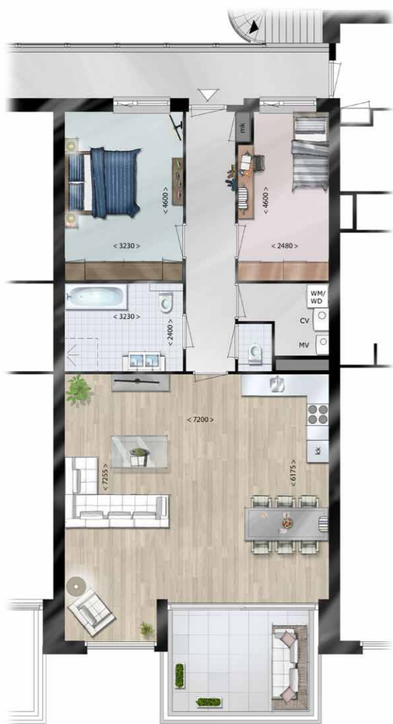
Plattegrond tussenappartement 100m 2